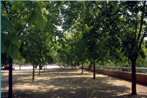
1 Morus alba "Fruitless"