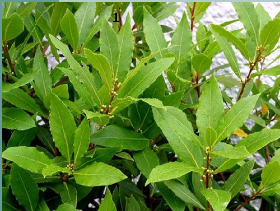
3 Laurus nobilis (llorer)