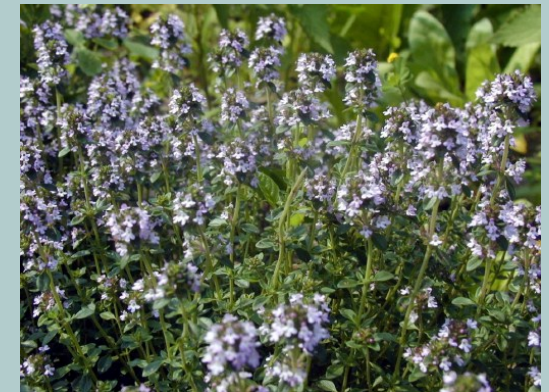
5 Thymus vulgaris (farigola)