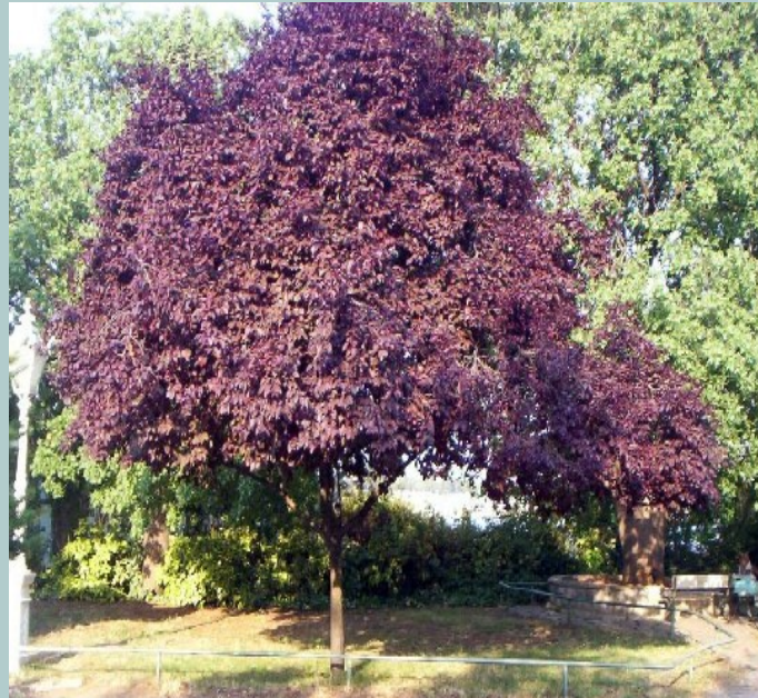
2 Prunus cerasifera nigra