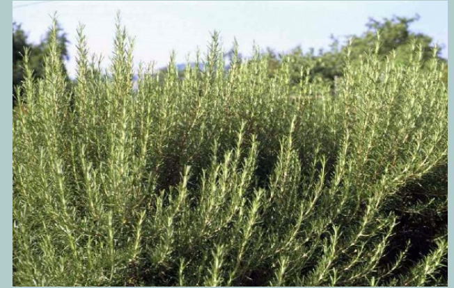
4 Rosmarinus officinalis (romani)